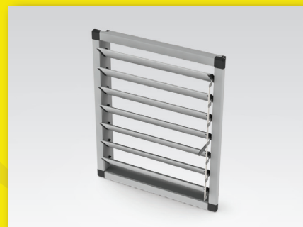
Wloty tunelowe JLZ