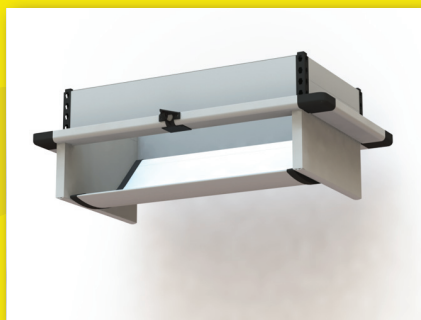
Wlot sufitowy PVH-E