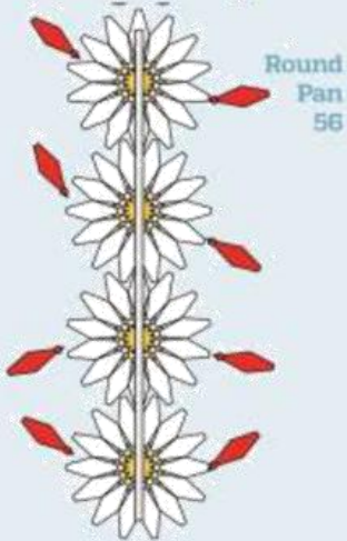
Round Pan 56